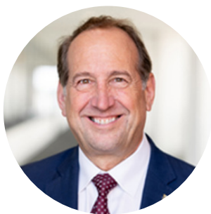
John A. Squires USPTO 局长

今年 9 月，美国专利商标局（USPTO）迎来了 John A. Squires 的加入，其现任美国商务部负责知识产权事务的副部长以及 USPTO 局长。斯奎尔斯局长是美国知识产权领域的首席负责人，负责就知识产权政策、推进美国创新以及提升美国全球竞争力等事宜，向商务部长霍华德·卢特尼克、